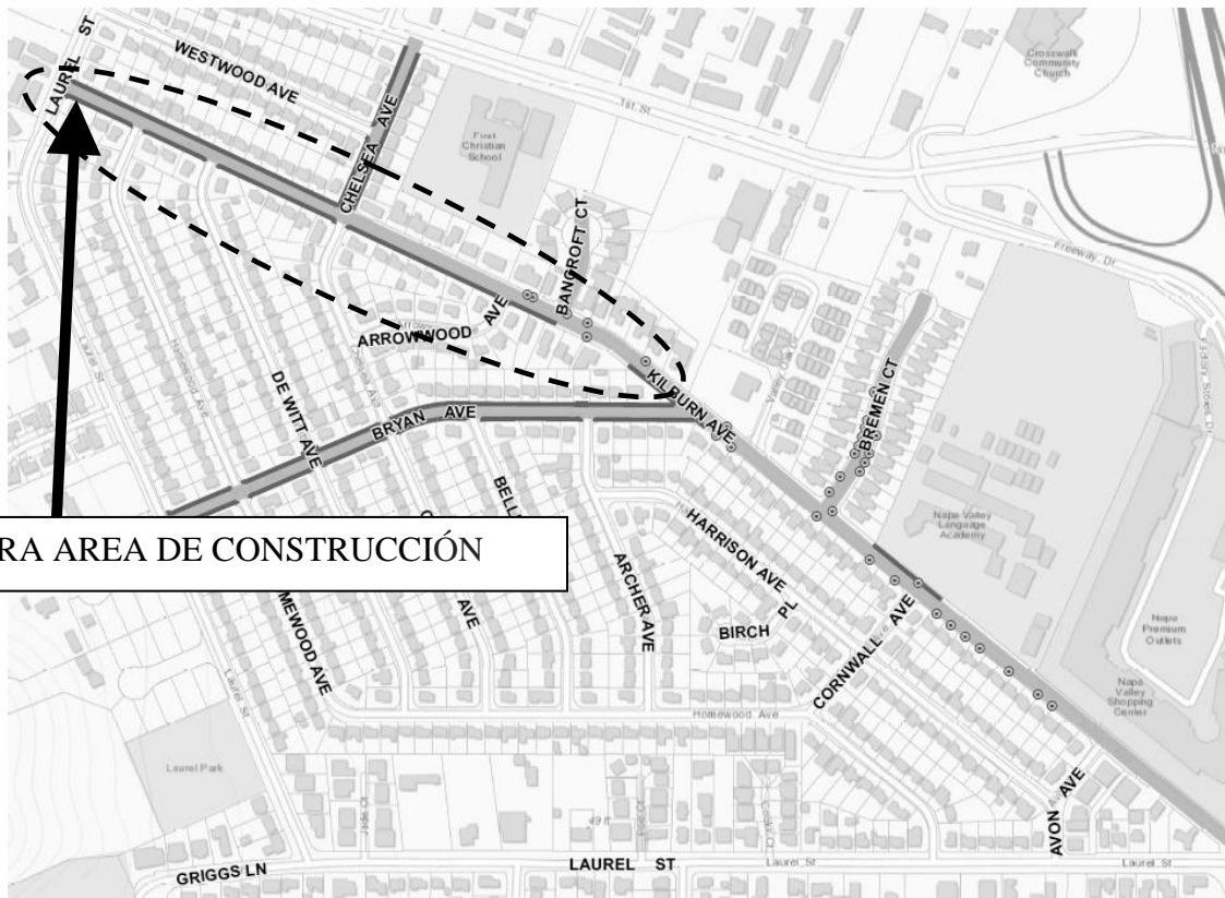
Mapa de el área del Proyecto